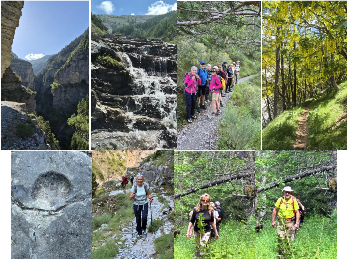
Une coquille Saint Jacques