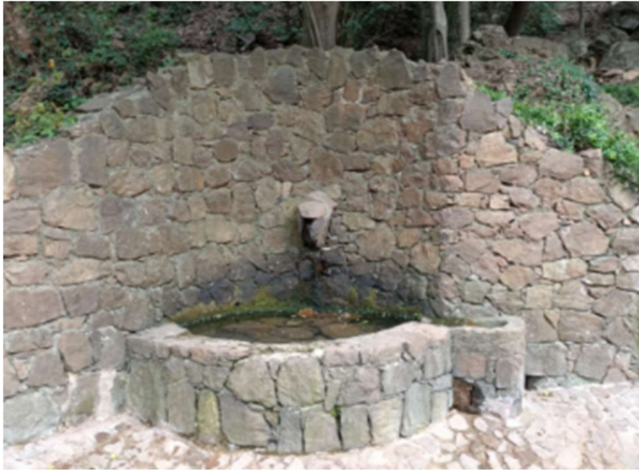
Fontaine du plateau de Notre Dame