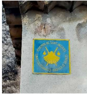
Notre-Dame-des-Anges Hospitalité pèlerins Plaque commémorative