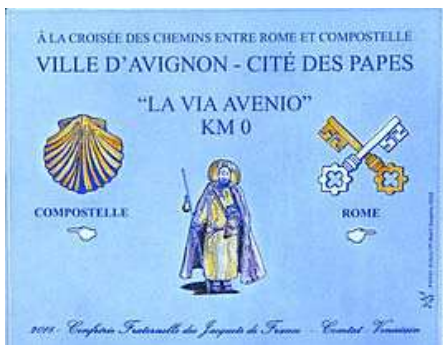
Avignon (84) Plaque commémorative Palais des papes 2018

(en remplacement d'une plaque plus ancienne)