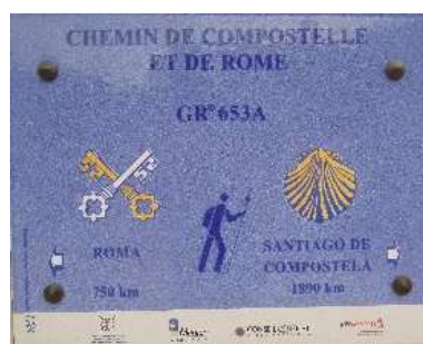
Menton (06) Port de Garavan Plaque commémorative 2010