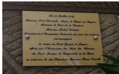
Plaque commémorative et profil de saint Jacques 2012