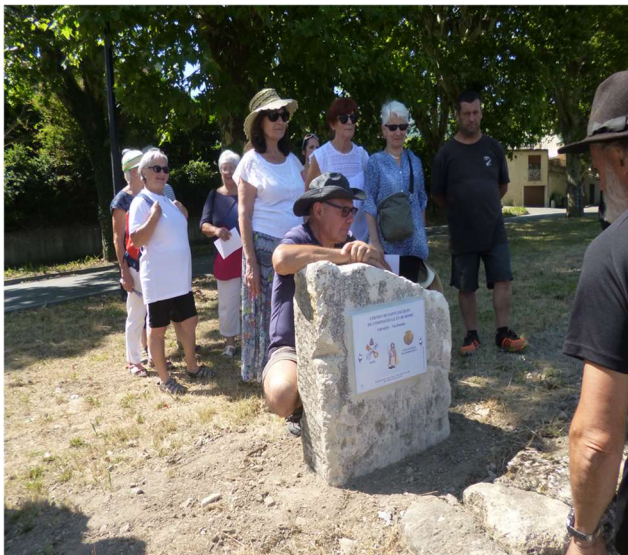
Céreste-en-Luberon (04) Stèle et plaque commémorative 2018