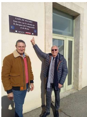
Maubec (84) Ancienne gare de Maubec-Coustellet Plaque commémorative (Municipalité) 30.01.2026