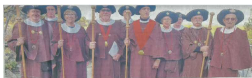
(Confrérie Fraternelle des Jacquets de France)