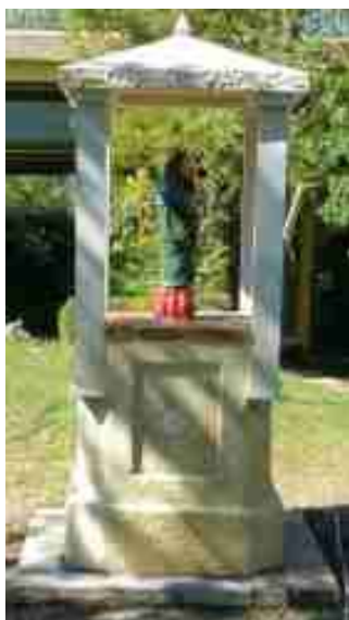
Mandelieu-la-Napoule (06) Oratoire Saint-Jacques-le-Majeur 2016