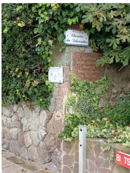
Théoule-sur-Mer (06) Promenade André Pradayrol Plaque commémorative 2018