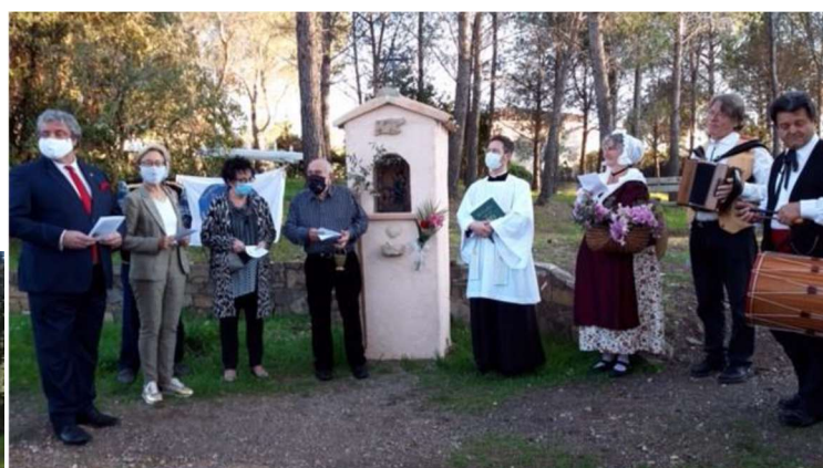
Saint-Raphaël (83) Vallon de l'Armitelle Oratoire Saint-Jacques 2019