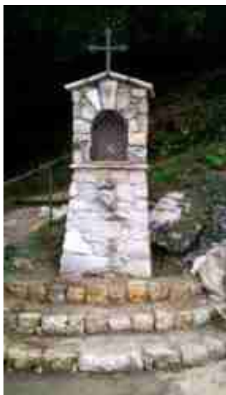
Tourrette-Levens (06) Tralatorre Oratoire Saint-Jacques 2013