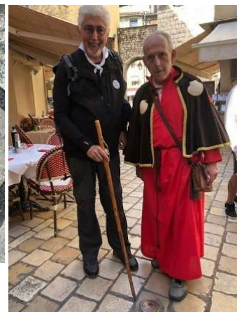
Roquefort-les-Pins (06) Clous-coquilles 2013