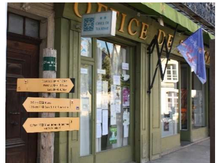
Forcalquier (04) Plaque commémorative 2019