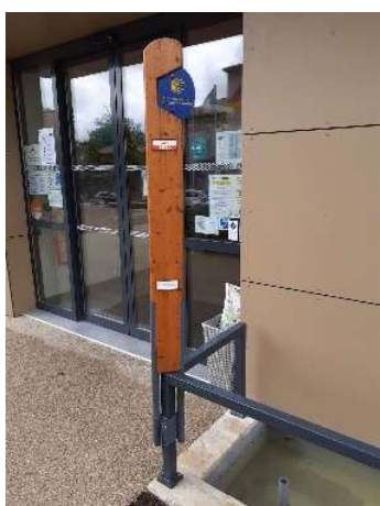
Stèle commémorative 2010