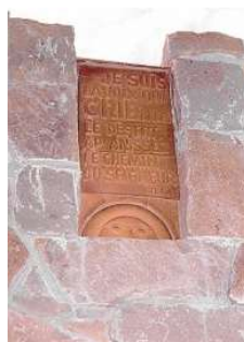
Gap (05) - Tourronde Plaque commémorative Saint-Jacques 2018