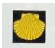
Montfort (04) Chante-Puvine Cairn 2017