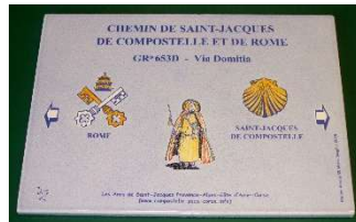
Jalon Saint-Jacques 2019 (Municipalité)