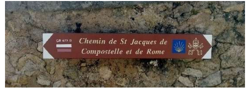
Panneaux signalétiques Saint-Jacques (Municipalité)