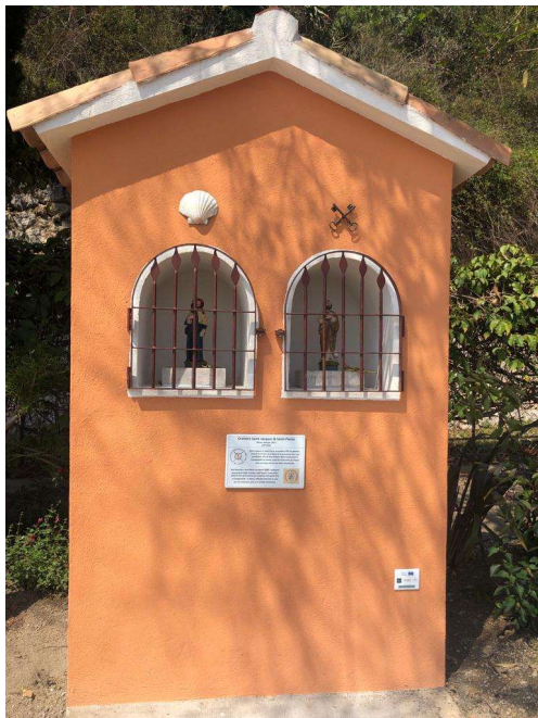
Menton (06) - Frontière Oratoire Saint-Jacques & Saint-Pierre 2023