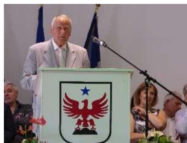
Aspremont (06) Plaque commémorative 2019