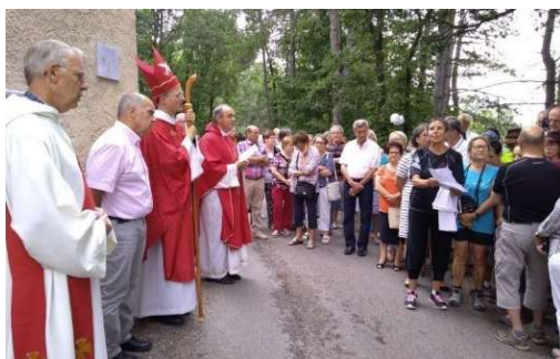
Gap (05) – colline de Saint-Mens Oratoire Saint-Jacques (et statuette saint Jacques) 2013