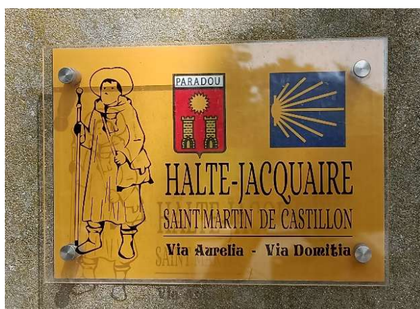
Paradou (13) Halte jacquaire