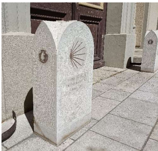
Marseille (13) église des Accoules Bornes jacquaires 2007