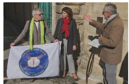
Apt (84) Plaque commémorative 2020 (Dévoilement)