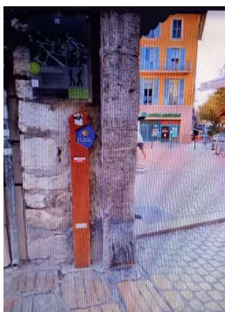
Jalon FFRP 2005