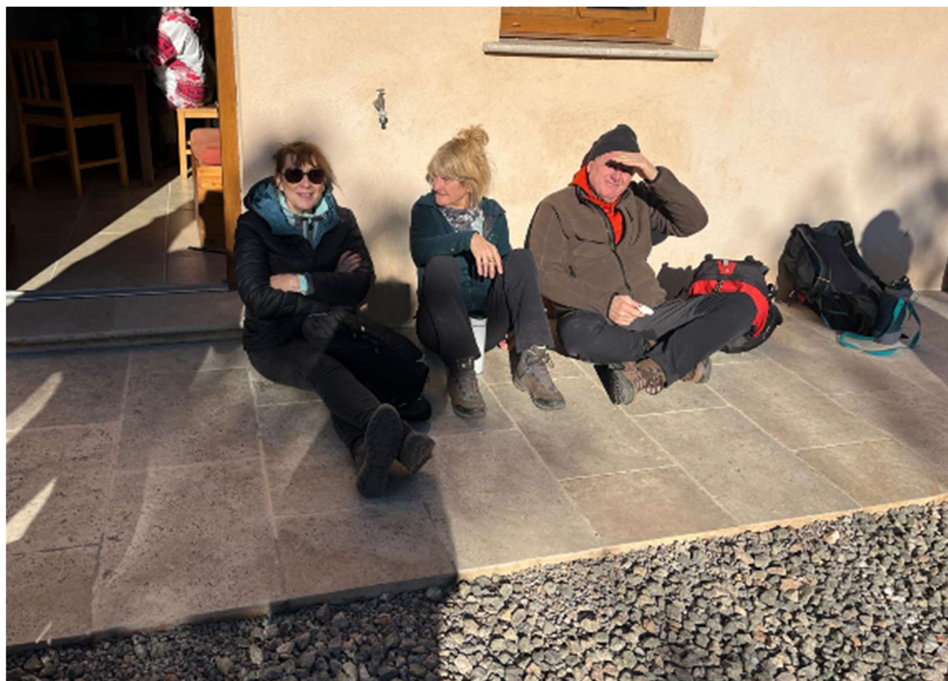
Galette des Reines et des Rois 2026 - Randonnée Le Thoronet - Carcès