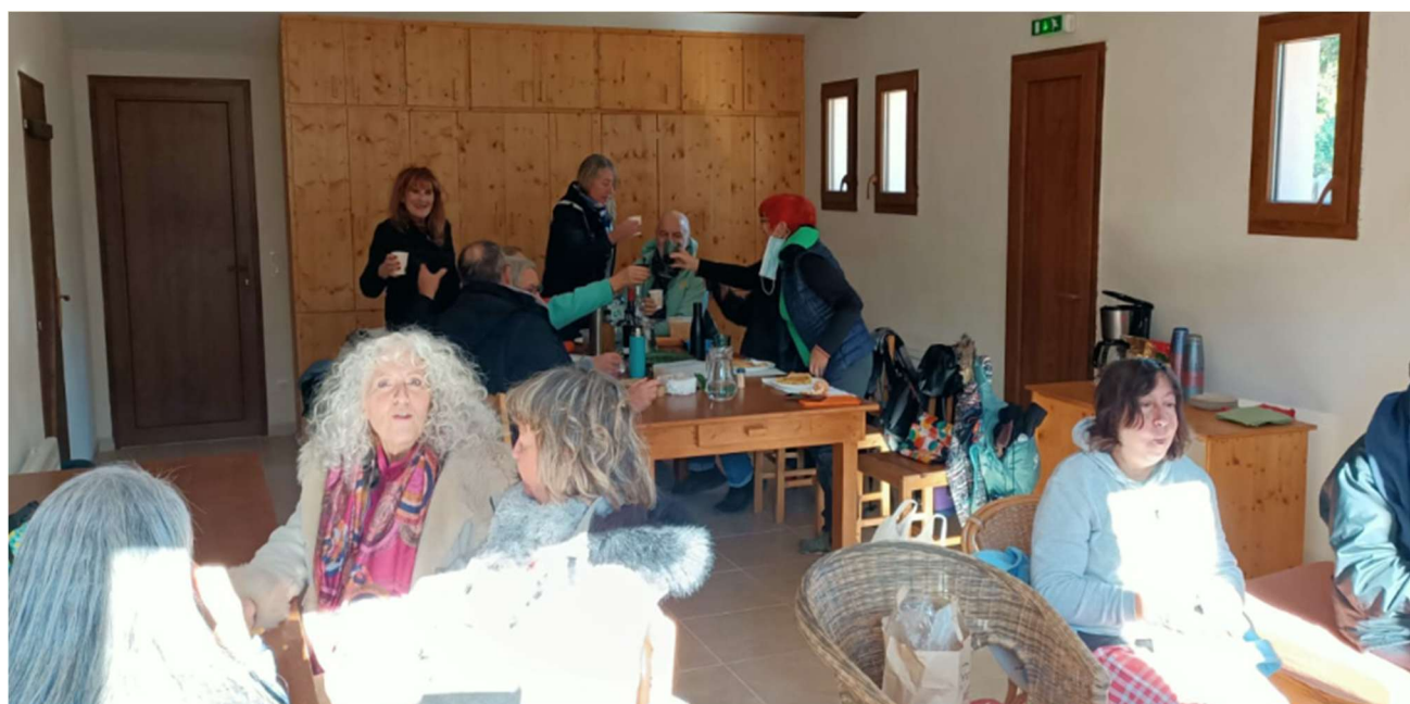
Galette des Reines et des Rois 2026 - Randonnée Le Thoronet - Carcès