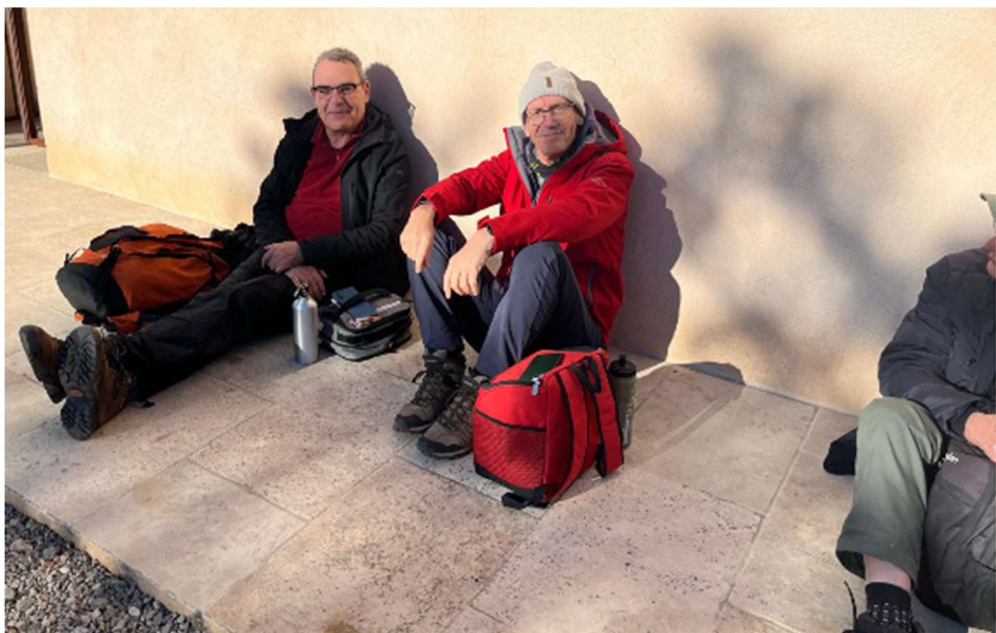
Galette des Reines et des Rois 2026 - Randonnée Le Thoronet - Carcès