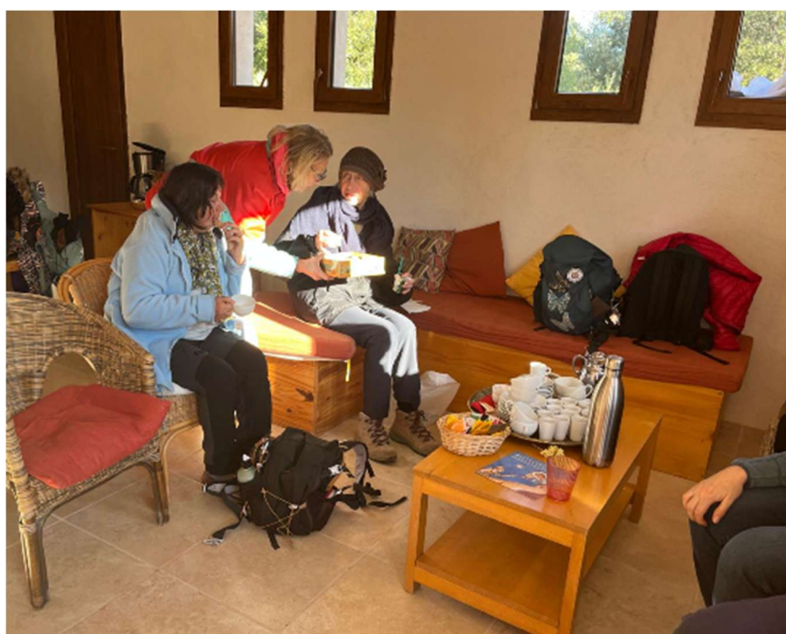
Galette des Reines et des Rois 2026 - Randonnée Le Thoronet - Carcès