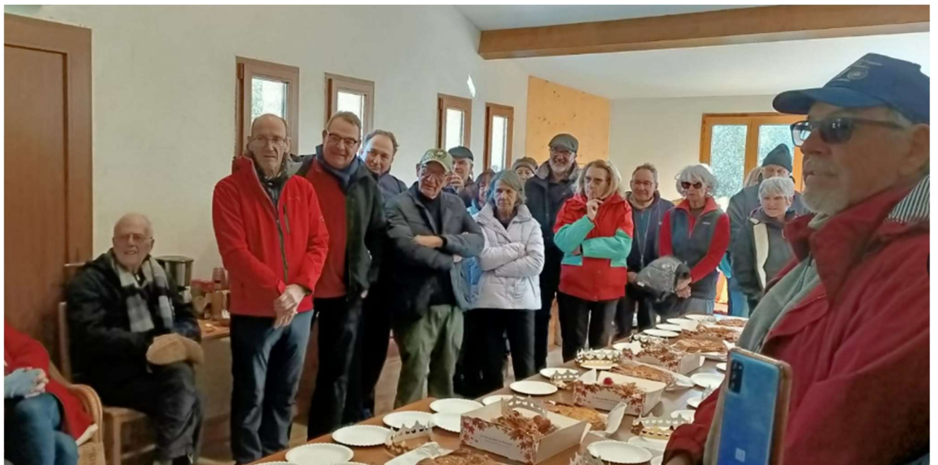
Galette des Reines et des Rois 2026 - Randonnée Le Thoronet - Carcès