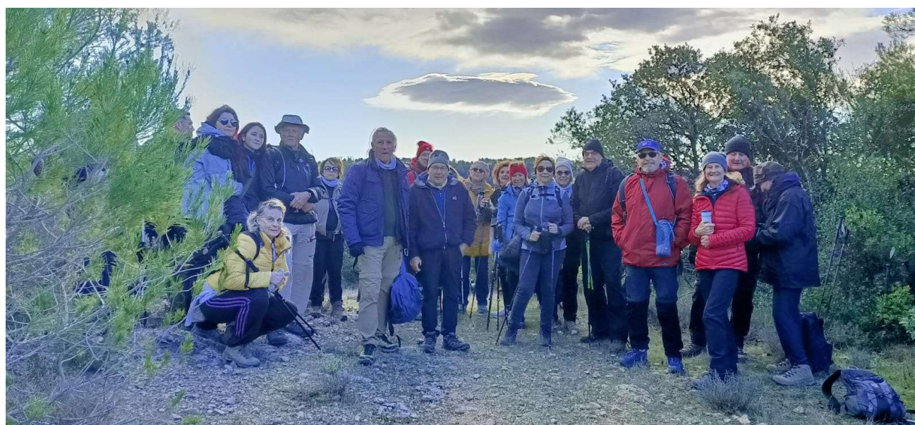
Galette des Reines et des Rois 2026 - Randonnée Le Thoronet - Carcès