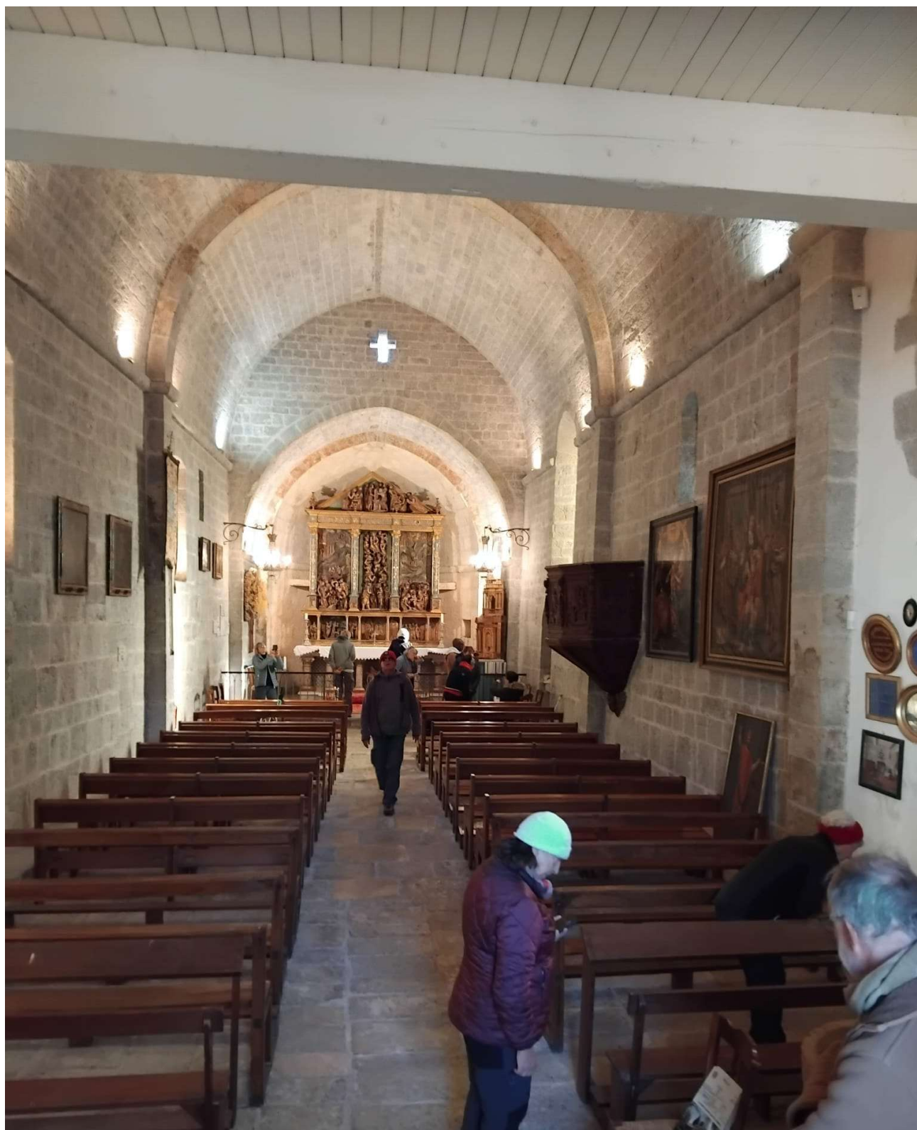
Randonnée des Trois Chapelles au Pays de Fayence