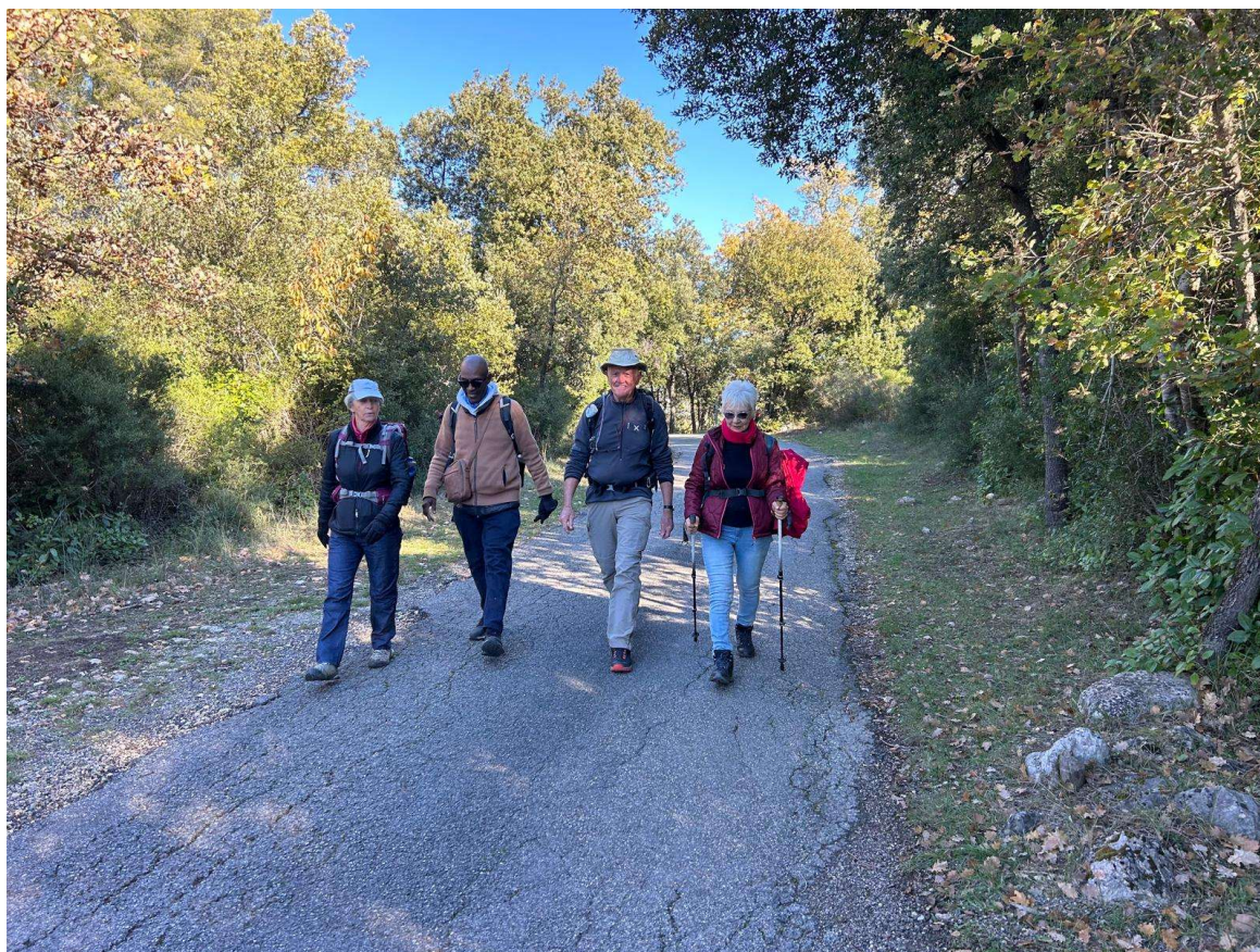
Randonnée des Trois Chapelles au Pays de Fayence