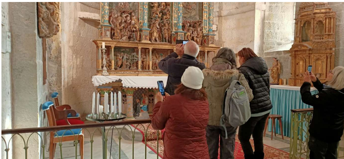
Randonnée des Trois Chapelles au Pays de Fayence