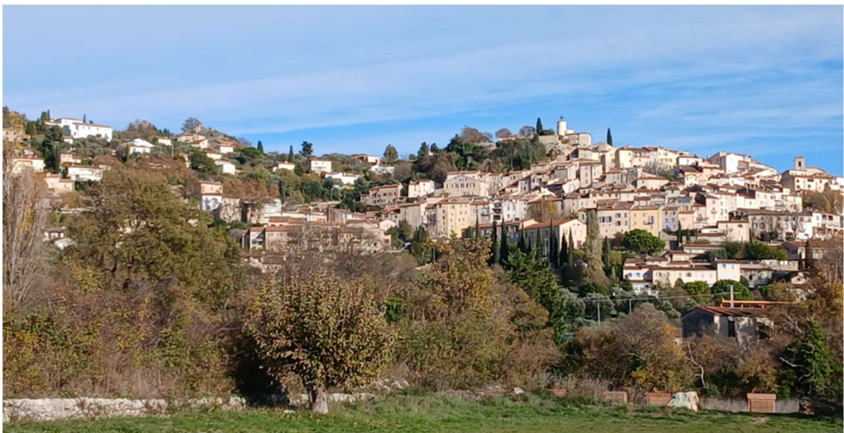
Randonnée des Trois Chapelles au Pays de Fayence

Enfin nous remontons vers Seillans, en empruntant l'ancienne voie ferrée, (direction Grasse via Fayence) et en passant devant la petite gare désormais fermée.