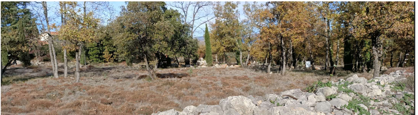
Randonnée des Trois Chapelles au Pays de Fayence