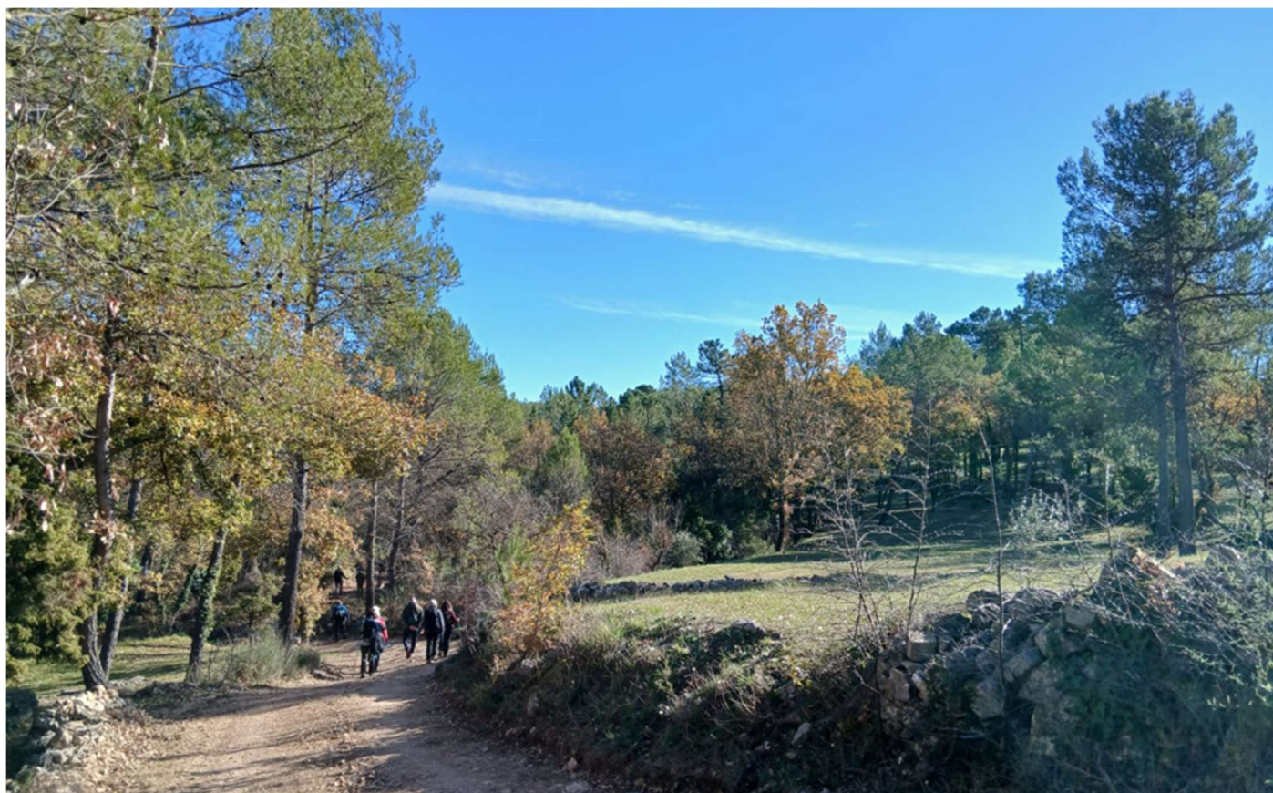
Randonnée des Trois Chapelles au Pays de Fayence