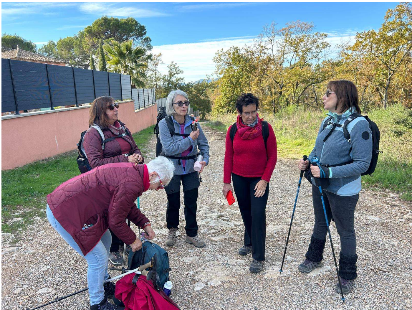
Randonnée des Trois Chapelles au Pays de Fayence