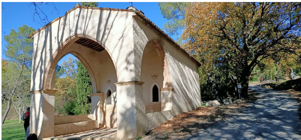
Randonnée des Trois Chapelles au Pays de Fayence