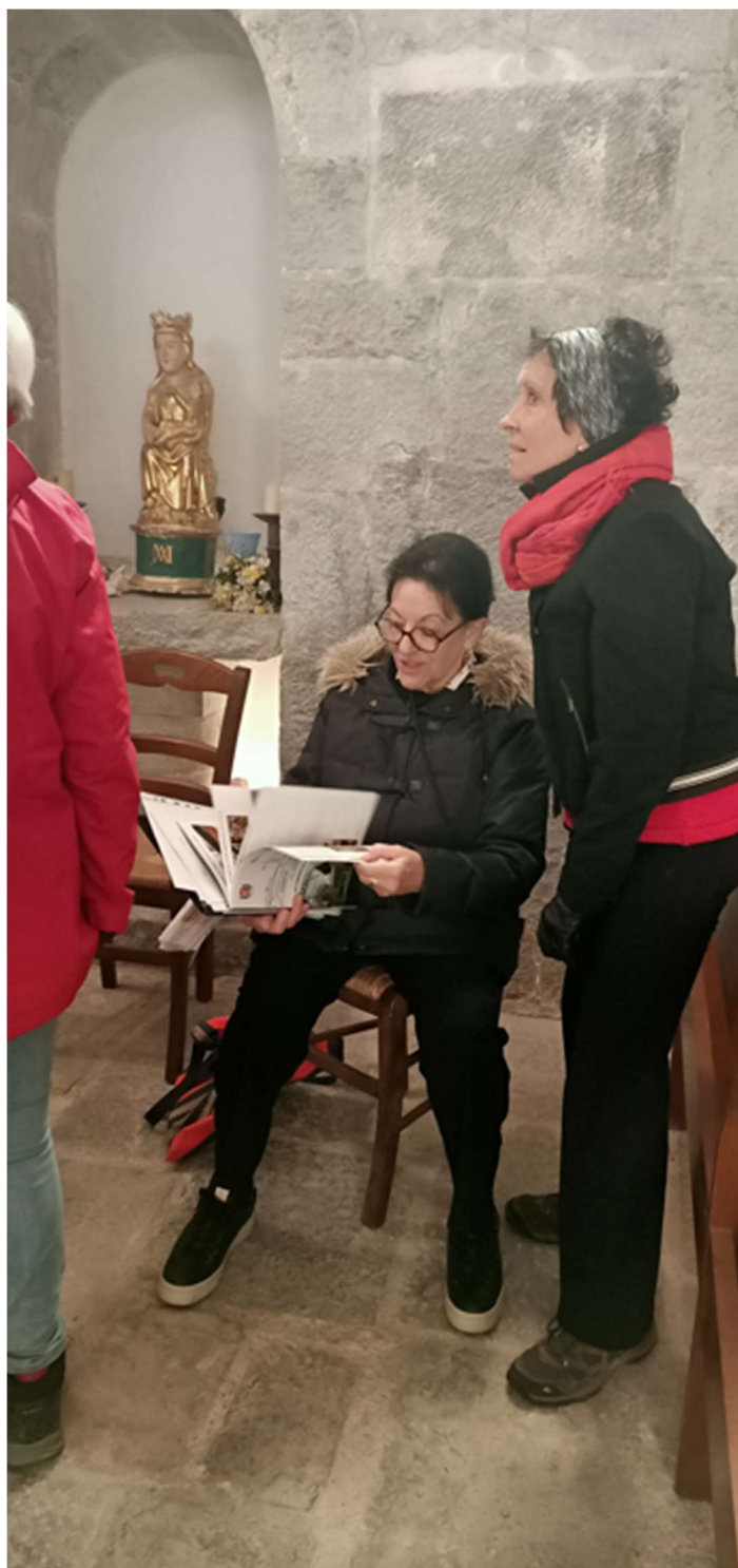
Randonnée des Trois Chapelles au Pays de Fayence