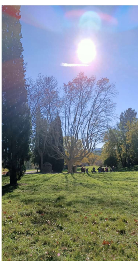
Randonnée des Trois Chapelles au Pays de Fayence