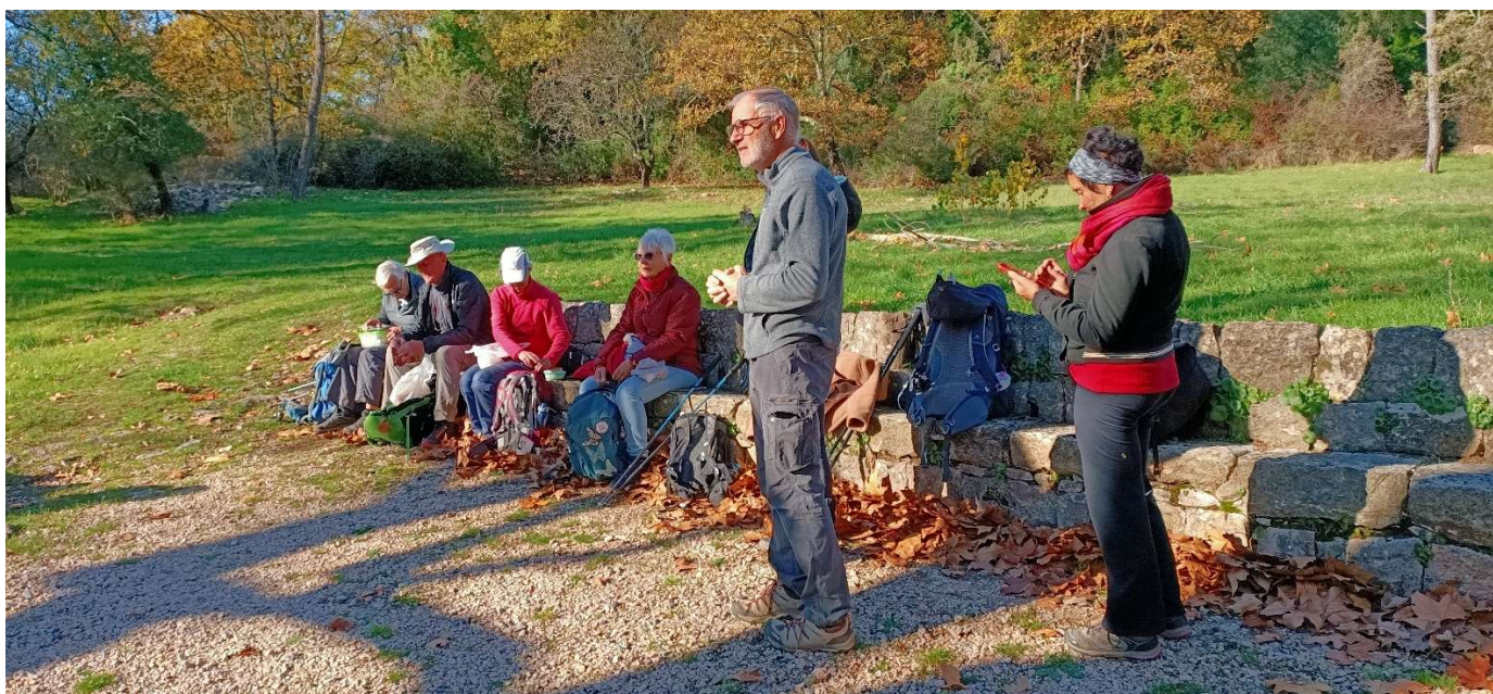
Randonnée des Trois Chapelles au Pays de Fayence