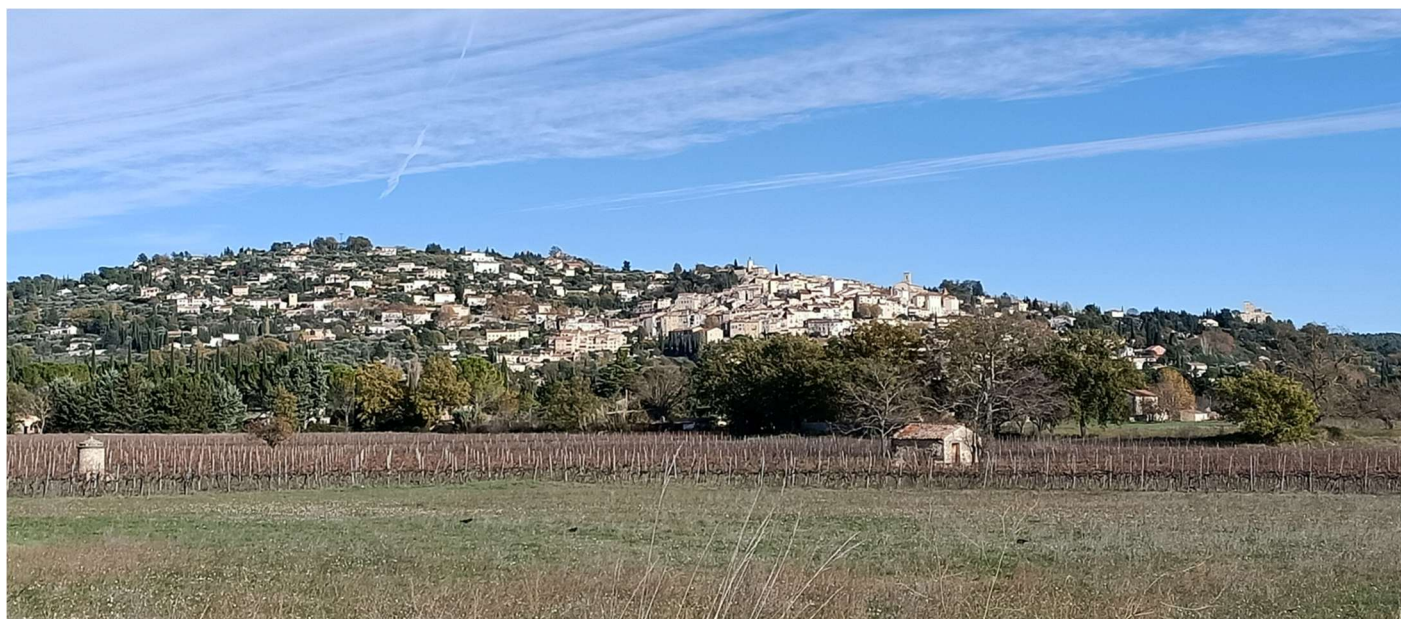
Randonnée des Trois Chapelles au Pays de Fayence