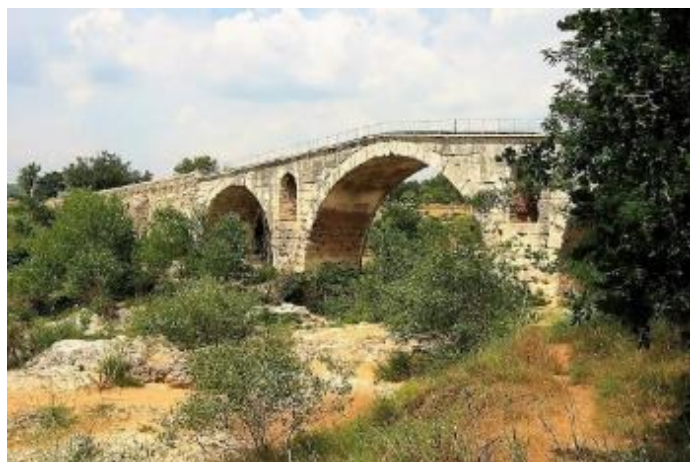
Pont Julien vers Apt (Via Domitia)