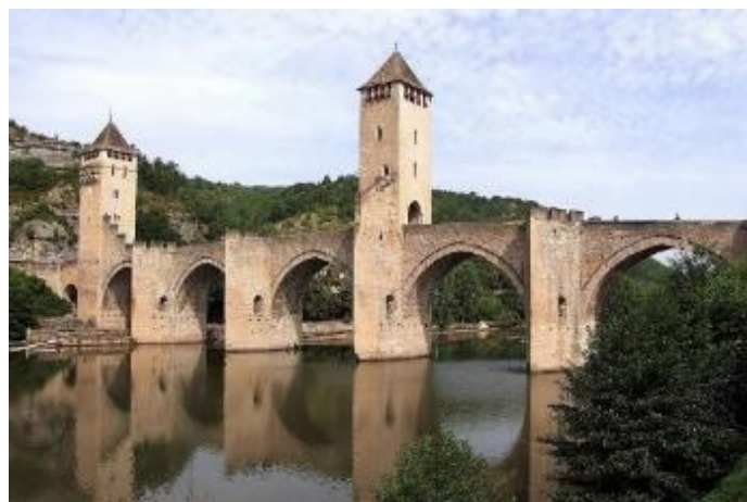
Pont Valentré à Cahors (Via Podiensis)