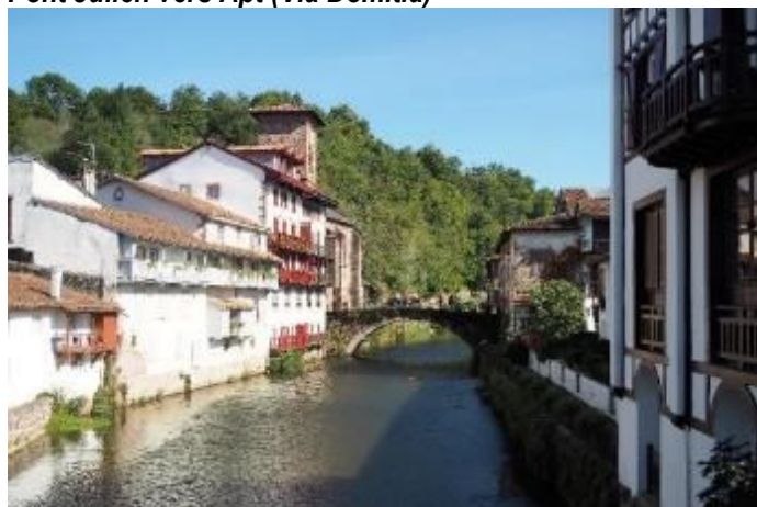
Pont Notre-Dame à St-Jean Pied de Port (Via Podiensis)