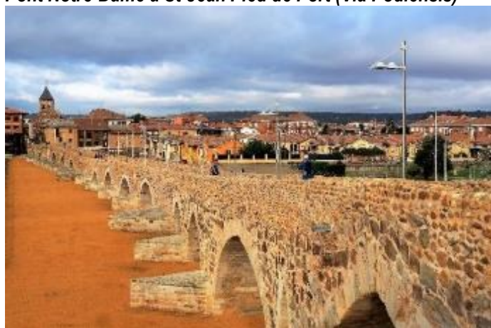
Pont del Paso Honroso à Hospital de Orbigo (Camino Francès)