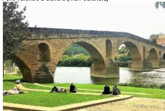
Pont de la Reine à Puente-la-Reina (Camino Francès)