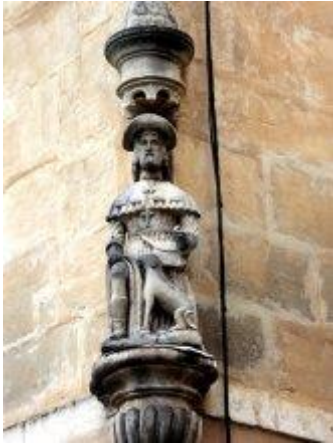
Statue de saint Roch