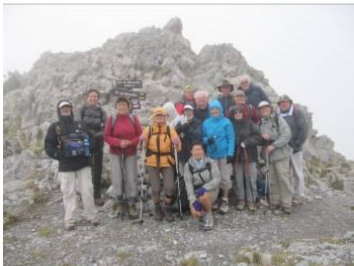
Au Col Bernardez