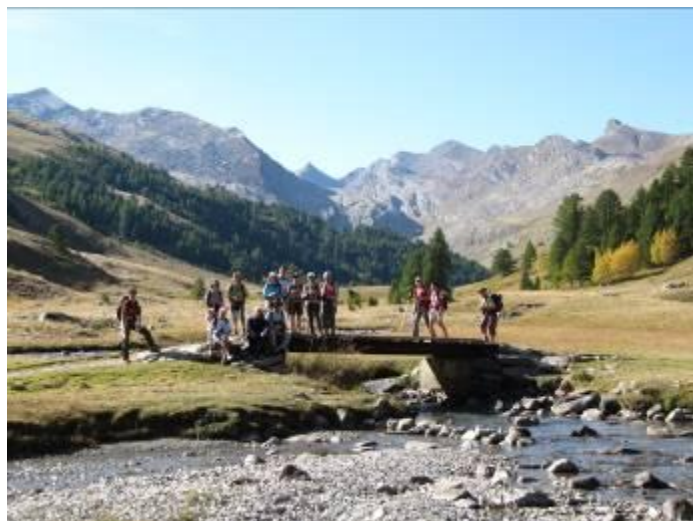
Au Col de Larche