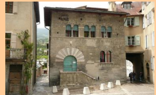
La Maison des Chanonges à Embrun