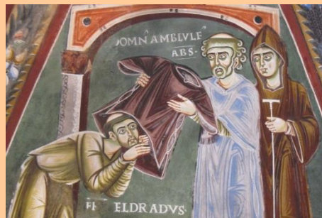
Abbaye de Novalèsa, fresque polychrome (détail)

Pour l'année prochaine, rendez-vous est pris, cette fois en France, à Aix-en-Provence, toujours le dernier week-end de septembre.