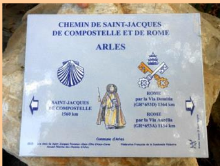
La plaque en Arles, à l'entrée des Alyscamps

En 2018, notre association aura 20 ans d'existence. Nous fêterons bien sûr cet anniversaire, ce sera lors de la prochaine rencontre franco-italienne qui se déroulera dans la vallée de l'Ubaye (Alpes de Haute-Provence) les 12-13 et 14 octobre 2018. Mais nous marquerons aussi l'évènement par une opération concernant directement les chemins de pèlerinage dans notre région : Via Domitia et Via Aurélia. Nous avons lancé la mise en œuvre de plaques signalétiques qui viendront compléter les trois plaques déjà existantes à Montgenèvre, Menton et Arles. Une douzaine de nouvelles plaques seront posées, en accord avec les communes concernées, au cours de cette prochaine année. La notion de chemins de pèlerinage s'en trouvera ainsi renforcée.