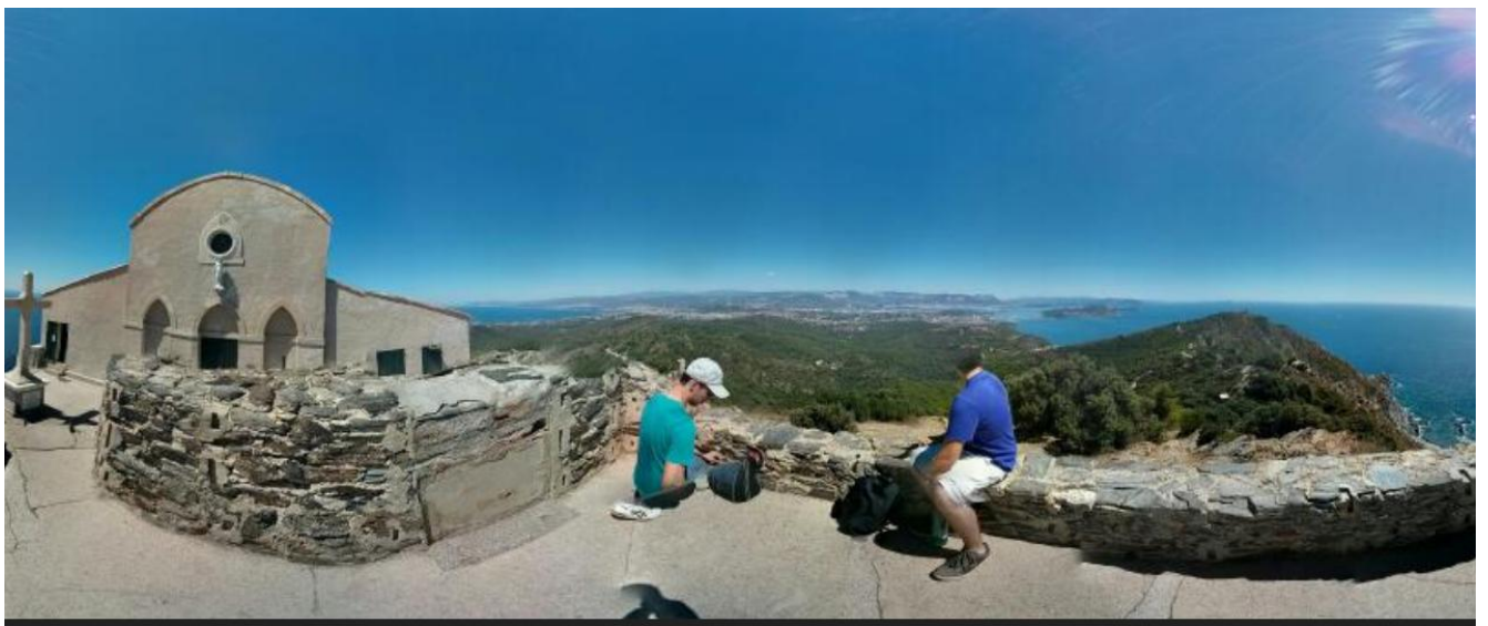
Vue de la rade de Toulon, l'une des plus belle d'Europe