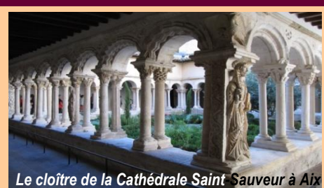
Le cloître de la Cathédrale Saint-Sauveur à Aix