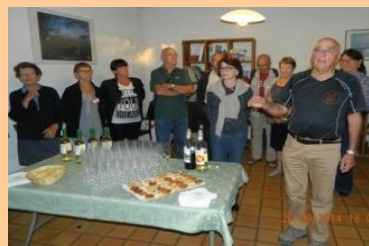
Une partie de nos accueillants

Pour l'année prochaine, direction l'Italie, nous vous informerons dès que les dates et le lieu seront fixés.