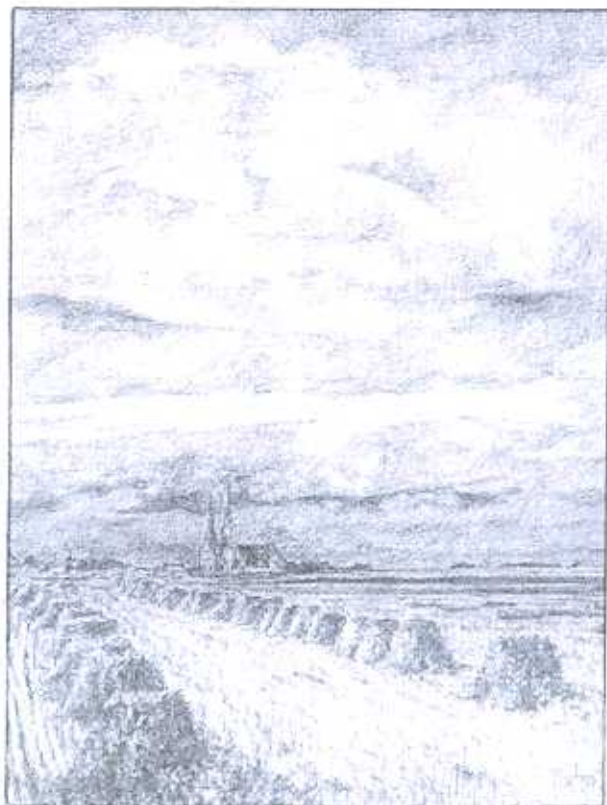
Soirée orageuse près de Chartres

(CRAYON et PASTEL encadré 30x40 - 80 à 120 € / HUILES selon format 300 à 480 €)